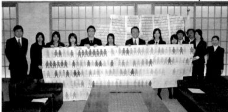
外務大臣を表敬した高校生等

具体的には、参加者 がメッセージを書き込 んだ人型の紙をオンラ インでつないで、世界 一長い「人間の鎖」を 作るというもの。ギネ スブックへ申請するほ か、6月にドイツで開 催されるG8ハイリゲ ンダム・サミットにも 届ける予定だ。 日本では、教育協力 NGOネットワーク (JNNE)などからな る実行委員会を中心と なって、このキャンペー ンを実施している。